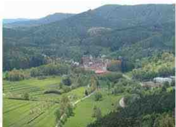
Schwanheim au milieu de la Pfälzer Wald

Notre petit magasin a la ferme est ouvert sur rendez-vous